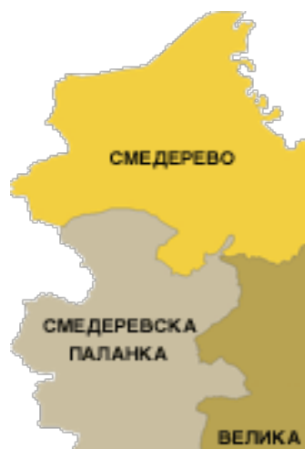
Слика 1. Подунавски округ

У североисточном делу Шумадије, некада прекривене густим листопадним шумама, налази се предео који је по реци што овим крајем протиче - добио назив Јасеница. Смедеревска Паланка заузима подручје које се, због близине ушћа ове реке у Велику Мораву, назива Доњом Јасеницом. Смедеревска Паланка, насеље на ушћу Кубршнице у Јасеницу, највеће место у Доњој Јасеници, економски је и културни центар, не само ближе, већ и шире околине. Град је окружен углавном великим селима, од којих су многа, по свом изгледу и уређености, данас слична варошицама. Општина Смедеревска Паланка налази се око 80 километара југоистично од Београда.